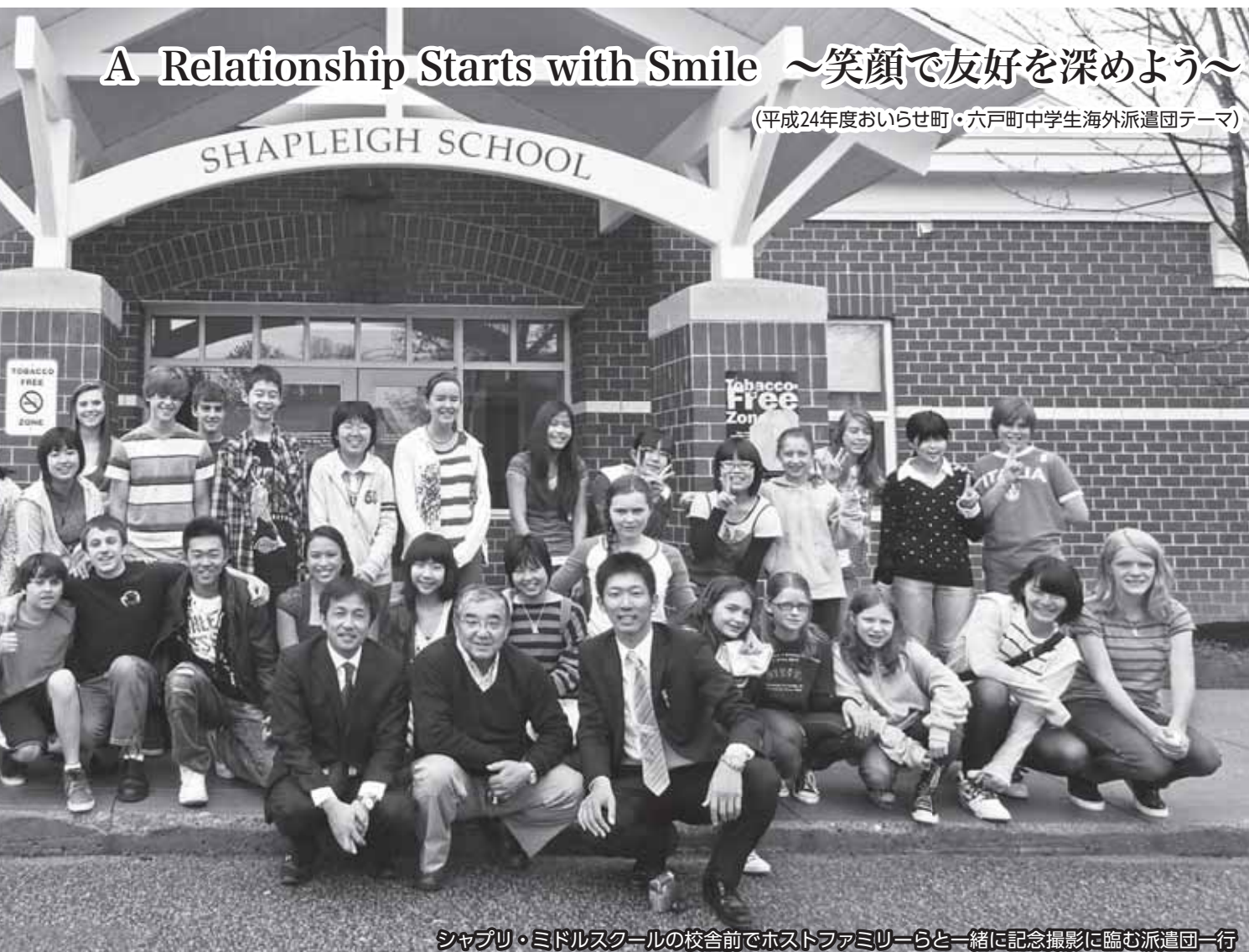
シャプリー・ミドルスクールの校舎前でホストファミリーらと一緒に記念撮影に臨む派遣団一行