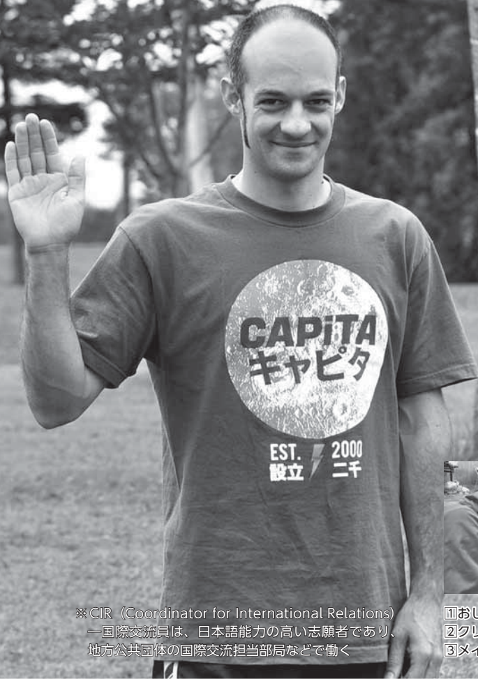
※ CIR (Coordinator for International Relations) 一国際交流員は、日本語能力の高い志願者であり、 地方公共団体の国際交流担当部署などで働く