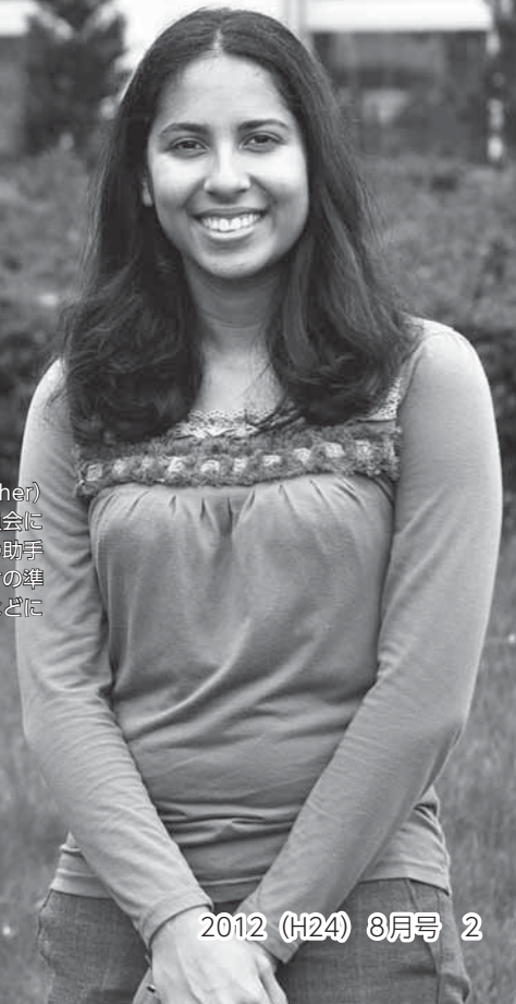
※ ALT (Assistant Language Teacher) 一外国語指導助手。学校や教育委員会に 配属され、日本人外国語担当教員の助手 として職務に従事したり、教育教材の準 備や英語研究会のような課外活動などに 従事したりする

一六戸町を訪れた時の印象は？ とっても緑が多いこと。それ に錦野公園とか景色がよくて素 敵だと思いました。 奥入瀬川の河川公園でジョギ ングするのが大好きでした。 一初めての土地で困った事は？ 初めての3週間は外国人登録証 がないので、携帯電話やインタ ーネットの契約ができませんでした。 近くにはネットカフェもな いので、アメリカの家族や友人 と連絡がとれず最初はとても寂 しい思いをしました。 一六戸で過ごした2年間の 思い出は？ 六戸の秋まつりで流し踊りに 参加し「六戸音頭」が好きにな りました。CDをもらったので、 帰ってから家族に教えたいです。