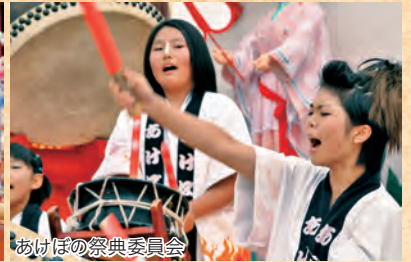
あけぼの祭典委員会