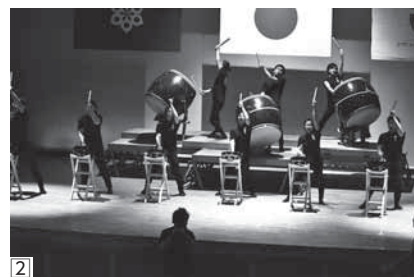
②「囃子やー」による南部祭囃子の創作演舞に 会場からは、この日一番の拍手が送られていた