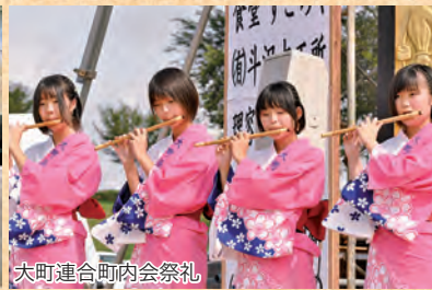
大町連合町内会祭礼