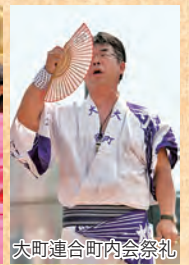
大町連合町内会祭礼