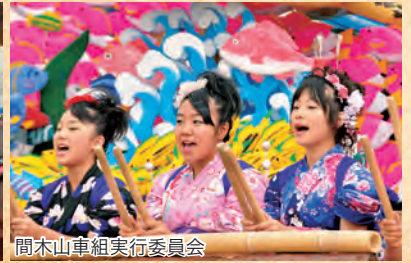
間木山車組実行委員会