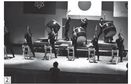
②「囃子や一」による南部祭囃子の創作演舞に会場からは、この日一番の拍手が送られていた