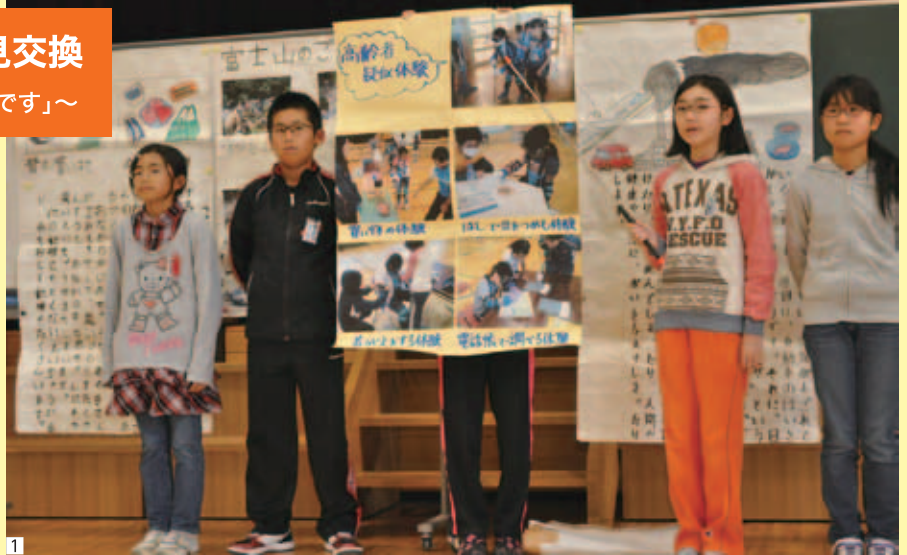
1 町の高齢者施設の体験内容を発表する児童たち

最後に三村知事は「みんなの発表が素晴らしかった。よく調べてくれました。いろんな課題に自ら気付いてチャレンジする心を持って未来へ進んでくれたらうれしいです」とエールを送り、青森県の明日を担う子どもたちに期待を寄せていました。