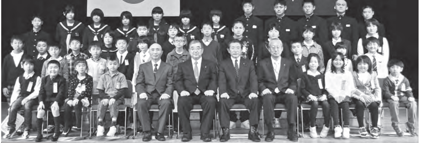
教育奨励賞受賞者