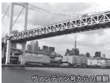
ヴァンテアン号からの景観

行程は、出航して間もなく右舷に東京タワーを眺め、レインボーブリッジの真下を通過すると、お台場の人気スポットやフジテレビが見られます。東京スカイツリーがいろんな角度で素晴らしい景色を見せてくれ、大パノラマを堪能できる