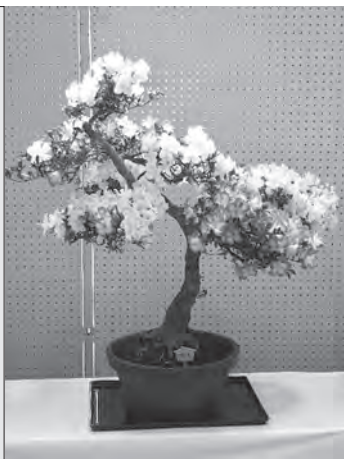
『さつき』の育て方などのアドバイスも行いますので、お気軽にご相談ください。