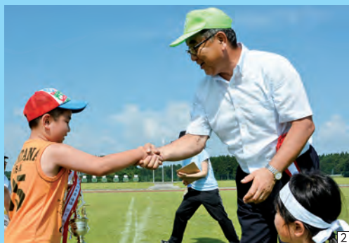
4メモに書かれたお題に合う人を見つけ、ゴールを目指す「借り人競走」