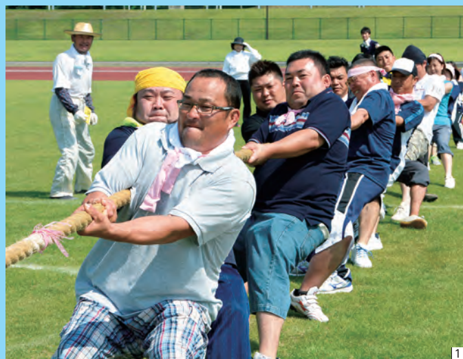
1「綱引き」10連覇を達成した昭陽チーム