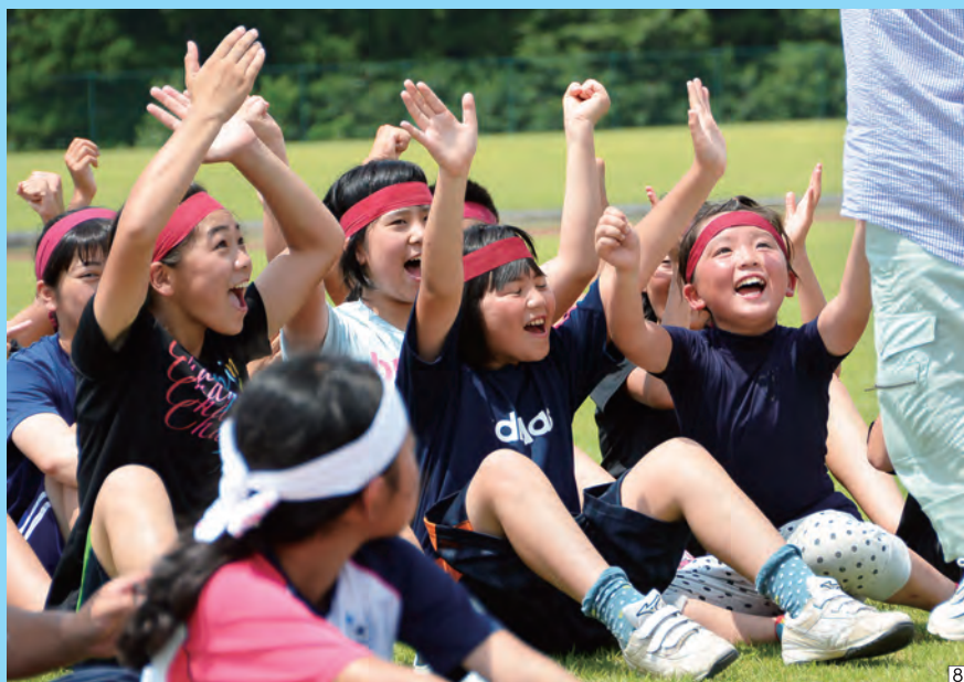
82年連続優勝を喜ぶ七百チームの選手たち