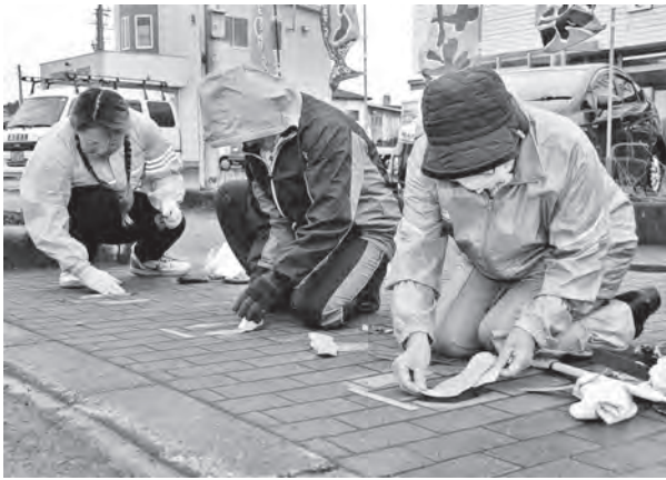
1枚ずつ丁寧に貼り替えを行う会員たち