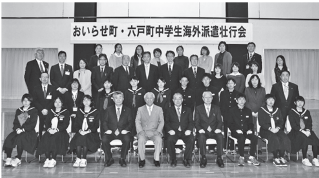
海外派遣団のメンバーと保護者たち