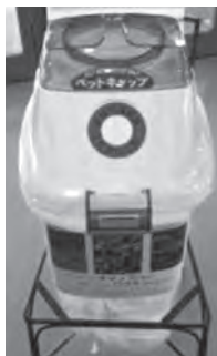
▲ペットボトルキャップ回収ボックス

競輪場外車券売り場サテライト六戸では、特定非営利法人「エコねっと未来あおもり」が行っている、「ペットボトルキャップを集めて世界の子どもにワクチンを届けよう!」の活動に協賛し、売り場内にペットボトルキャップ回収ボックスを設置して、来場されたお客さまおよび地域の皆さまにご協力をお願いしています。