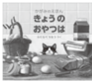
きょうのおやつはかがみのえほん