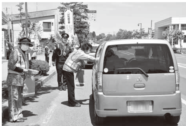
ドライバーに安全運転を呼び掛ける会員たち

活動に参加した会員らは、行き交うドライバー一人ひとりにチラシを手渡し、安全運転を呼び掛けました。