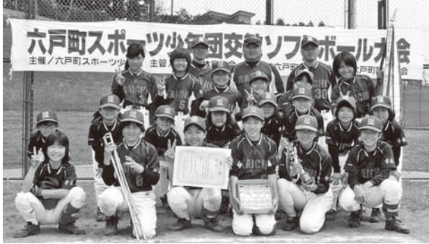
優勝した開知スポーツ少年団ソフトボール部

5月9日、町総合運動公園多目的広場で第25回六戸町スポーツ少年団ソフトボール大会が開催。開知スポーツ少年団ソフト部が平成9年の創部以来初の優勝を飾り、7月25日に青森市で行われる県大会への出場権を手に入れました。