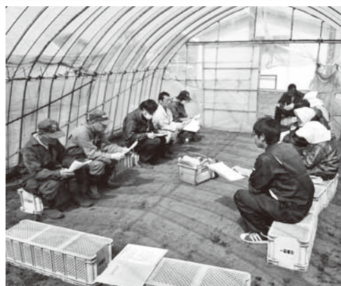
大曲地区で行われた現地指導会の様子

指導にあたった農協指導課職員は、「今年は苗の育成が順調に進んでいるので、このまま気を抜かずに管理をしてほしい」と話していました。