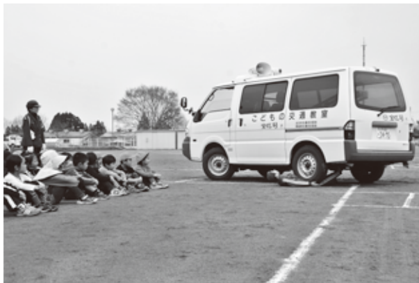
ダミー人形を用いた、左折車による歩行者の巻き込み事故の再現