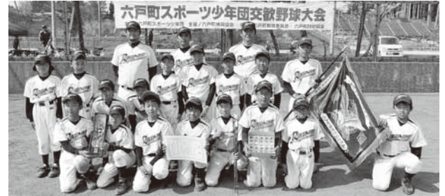
優勝した六戸スポーツ少年団野球部