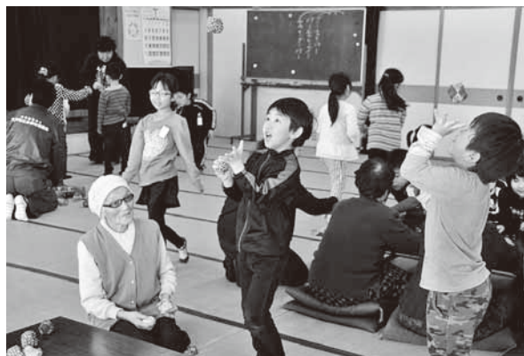
お手玉で遊ぶ児童たち

児童たちはお年寄りを囲み、食事や遊びなど昔の生活の様子についてインタビュー。現在との違いに驚きの声をあげていました。その後はけん玉やお手玉、メンコなど昔の遊びを教えてもらいながら一緒に楽しみ、お礼に児童全員で合唱と肩もみをプレゼントしました。