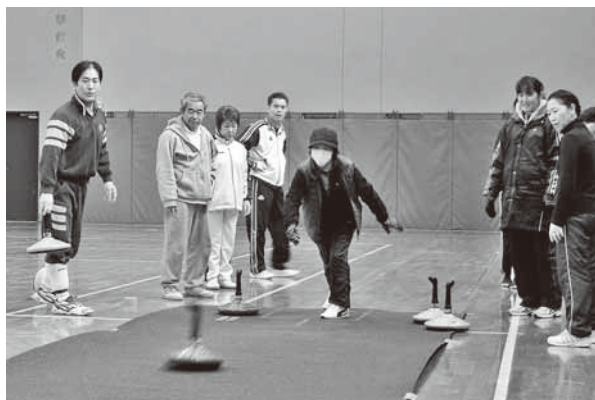
ユニカール(室内カーリング)を楽しむ参加者たち