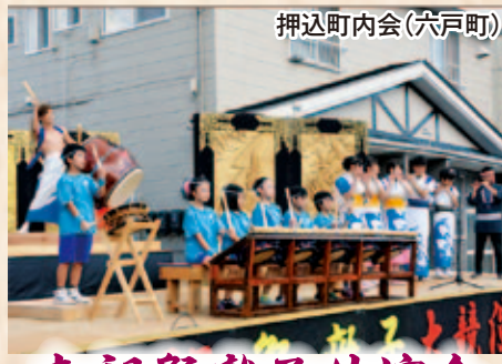
押込町内会(六戸町)