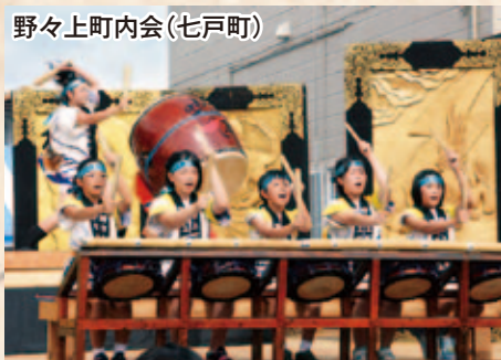
野々上町内会(七戸町)