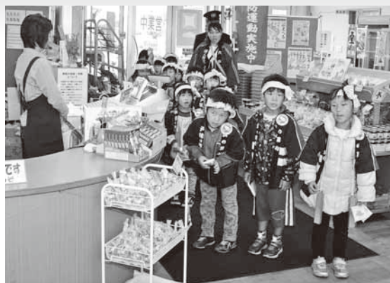
道の駅ろくのへで火災予防を呼び掛ける園児たち