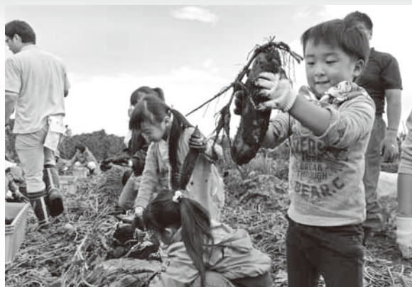
サツマイモ掘りを楽しむ園児たち