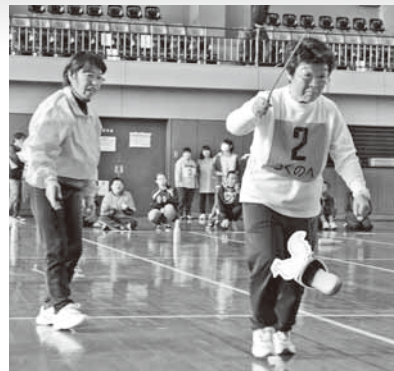
上手に「プレミアムシャモロック」を釣り上げる参加者

プログラムのうち、ピンを足で立て、なわとびを跳び、シャモロックを釣ってゴールを目指す『ろくのへプレミアムシャモロックレース』では、選手を応援する声が飛び交っていました。