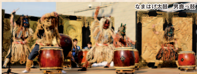
なまはげ太鼓 男鹿っ鼓