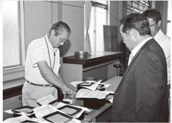
米の出来を検査する農協職員

検査を行った農産物検査員は「今年産は粒揃いが良く、膨らみがある」と評価していました。