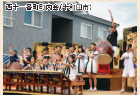
西十一番町町内会(柊和田市)