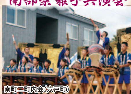
南町三町内会(六戸町)