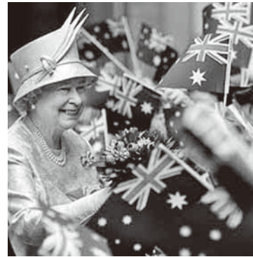
チャイニーズニューイヤー

らない政府で支配されているので、英連邦からの離脱と完全共和制を呼び掛ける声が近年少なくなってきた。