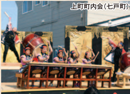
上町町内会(七戸町)