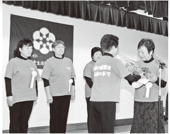
成田会長より感謝状と花束を受け取る会員