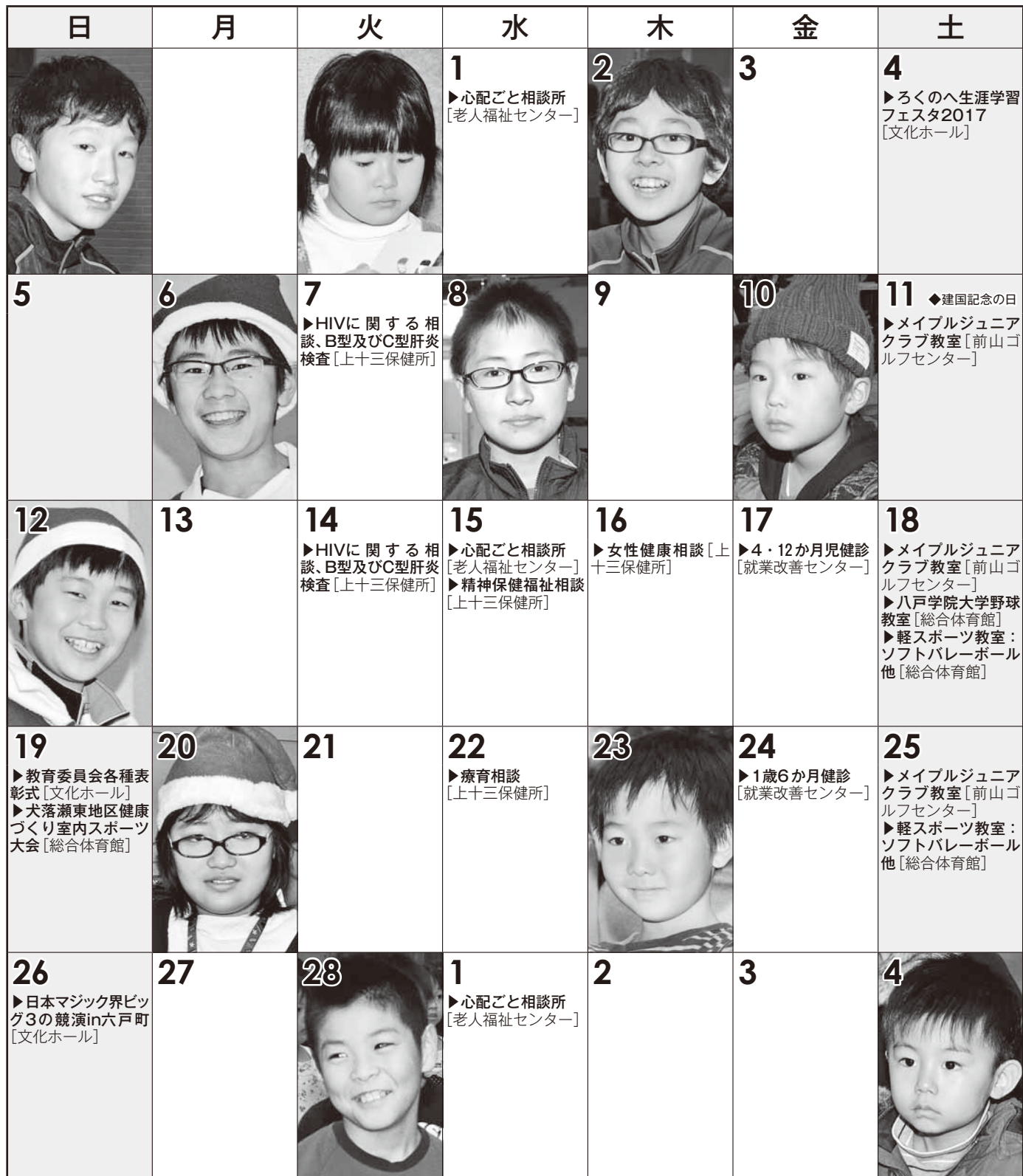
[今月の写真：子ども会クリスマスの集い]