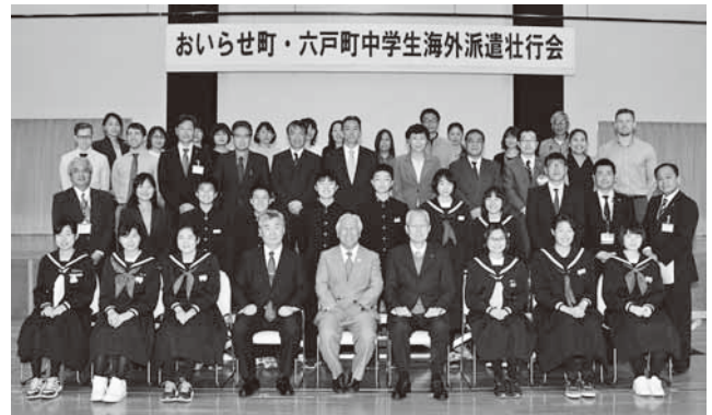
海外派遣のメンバーと保護者たち

続いて生徒らは、英語のスピーチや現地で行う日本文化のプレゼンテーションを披露。これまでの研修を通じて成長した姿を集まった関係者や保護者らに見せ、出発に向け決意を新たにしていました。