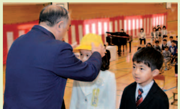
町交通安全協会から黄色い帽子が新入生に贈られた