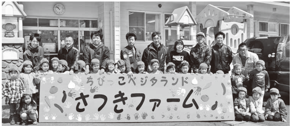
看板製作後の記念撮影