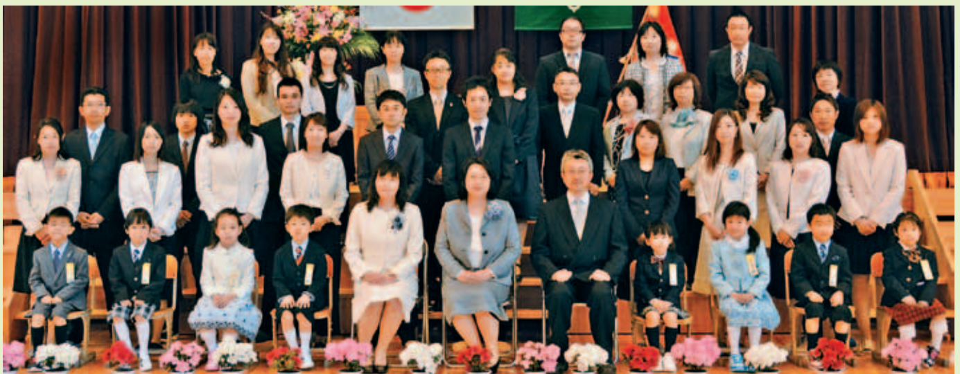
開知小学校1年生の子どもたち