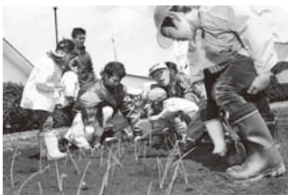
たまねぎの苗植え