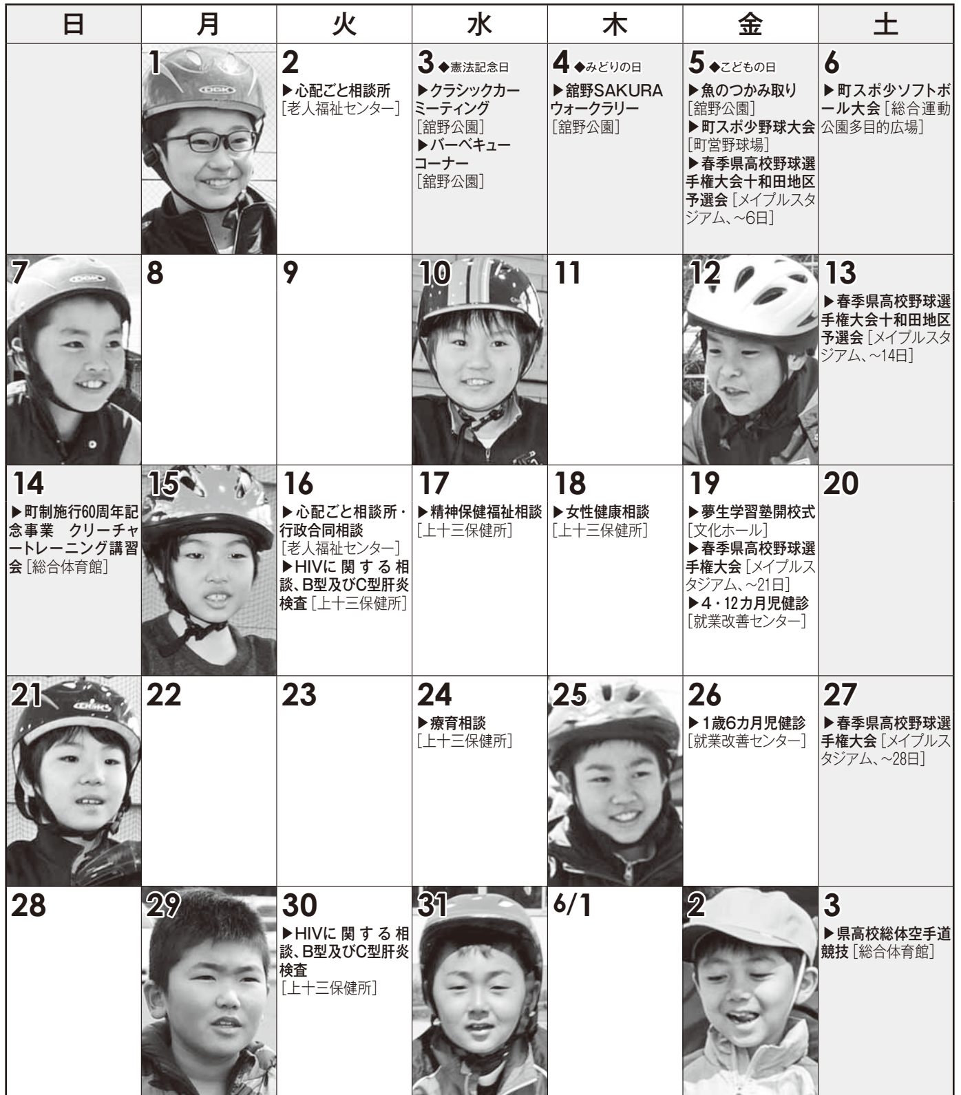
[今月の写真：各小学校交通安全教室]