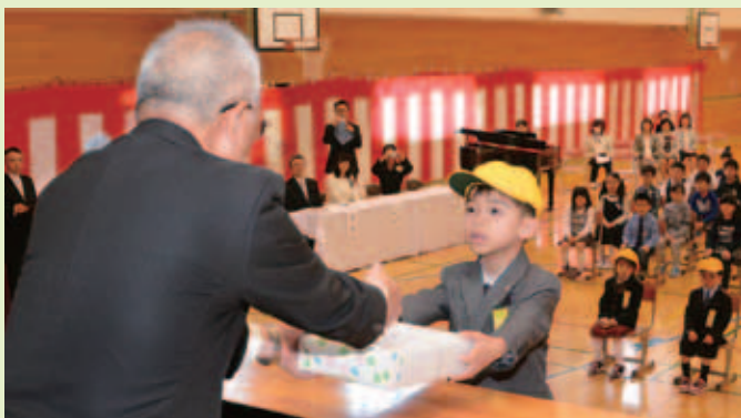
町防犯協会から防犯ブザーが新入生に贈られた