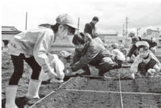
にんじんの種まき

園児らは若手農業者から種まきの仕方など指導を受け「大きくな～れ」と願いを込めながら2種類の作物を植え付けました。今後、時期に応じて他の作物も育てる予定。