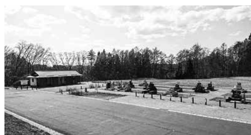
6割空いている町営墓地。町民ニーズは？

問 人口減少、核家族化の進行を見据え、町営墓地にも合葬墓の整備が必要ではないか 町長 合葬墓には、墓を管理する跡継ぎがいなくても利用できる、子供がいる場合でも墓の負担を残さずに済む、墓を建てる費用を抑えることができるなどの利点があります。その反面、複数人が一緒に埋葬されるため、他人と遺骨が混ざってしまう、遺骨を埋葬すると二度と取り出すことができません、地方自治体が設置した場合は供養のよいうな宗教行為ができないなど、多くの課題も想定されます。