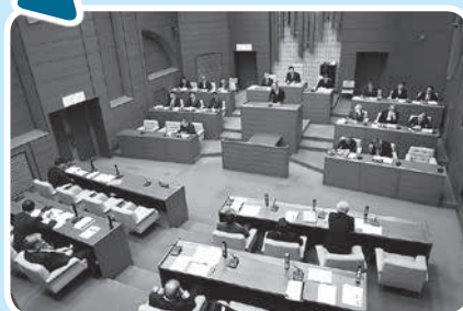
傍聴席から議場を見るとこんな感じです

これからの町のことを話し合う場、それが議場です。どんなふうに話し合いをするのか見て聴いてみませんか？