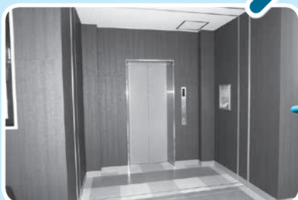
エレベーターで3階議場入口へ

これからの町のことを話し合う場、それが議場です。どんなふうに話し合いをするのか見て聴いてみませんか？