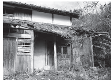
増加している空き家

全国的に、人口減少、高齢化により、空家が増加する傾向にあります。今回の計画を基に町内の空家の実態を把握し、危険な空家等の解消や、空家の有効活用を計画的に推進・支援をしていくために策定します。