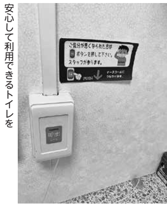
安心して利用できるトイレを

緊急時通報システムも含め、医療機関の中にある安心・安全な環境のトイレを設計し、リフォームしたいと思います。