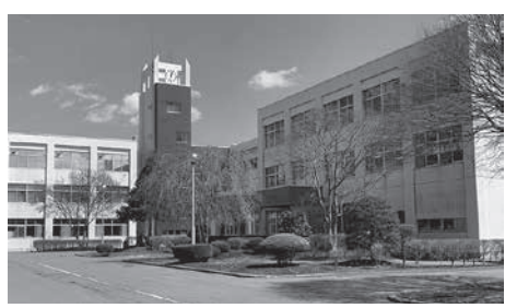
小中一貫校の候補地となっている六戸高校