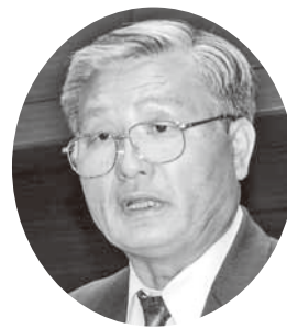
かわむら しげみつ 川村 重光 議員