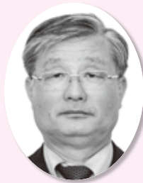
副議長 川村 重光