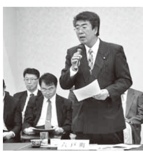
11月24日 知事を囲む行政懇談会 三村知事へ要望する六戸議長