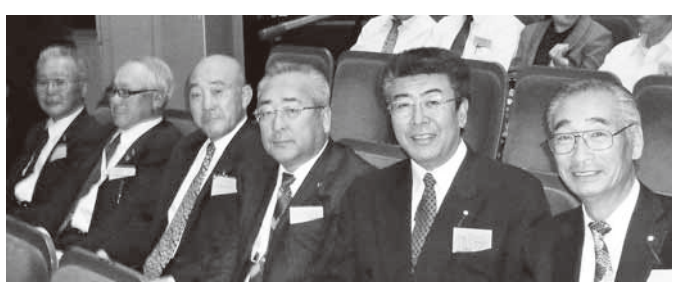
11月11日 全国議長大会に出席(東京都) 上北郡内の議長とともに