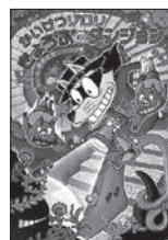
かいけつゾロリ きょうふのダンジョン 原 ゆたか