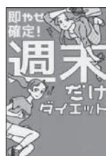
「即やせ確定」 週末だけダイエット 石本 哲郎