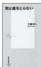
胃は歳をとらない 三輪 洋人