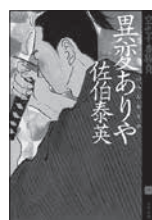
異変ありや 佐伯 泰英