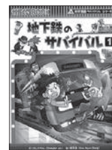
地下鉄のサバイバル(1) ゴムドリCO