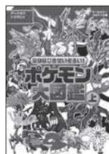
898ぴきせいぞろい! ポケモン大図鑑⑤ 楓 拓磨