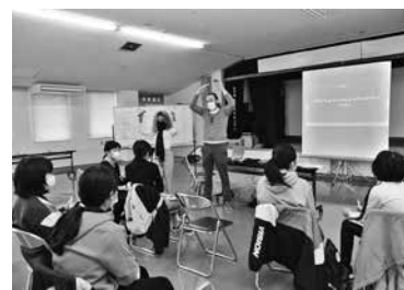
1月13日 楽しく英語を学ぼう ～イングリッシュ・サロン～