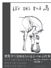
ぼくモグラキツネ馬 マッケジー・チャーリー