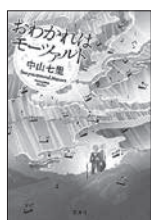
おわかれば モーツアルト 中山 七里