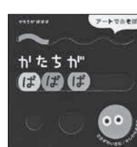
かたちがばばば ささがわ いさお