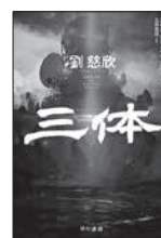
三体 劉 慈欣